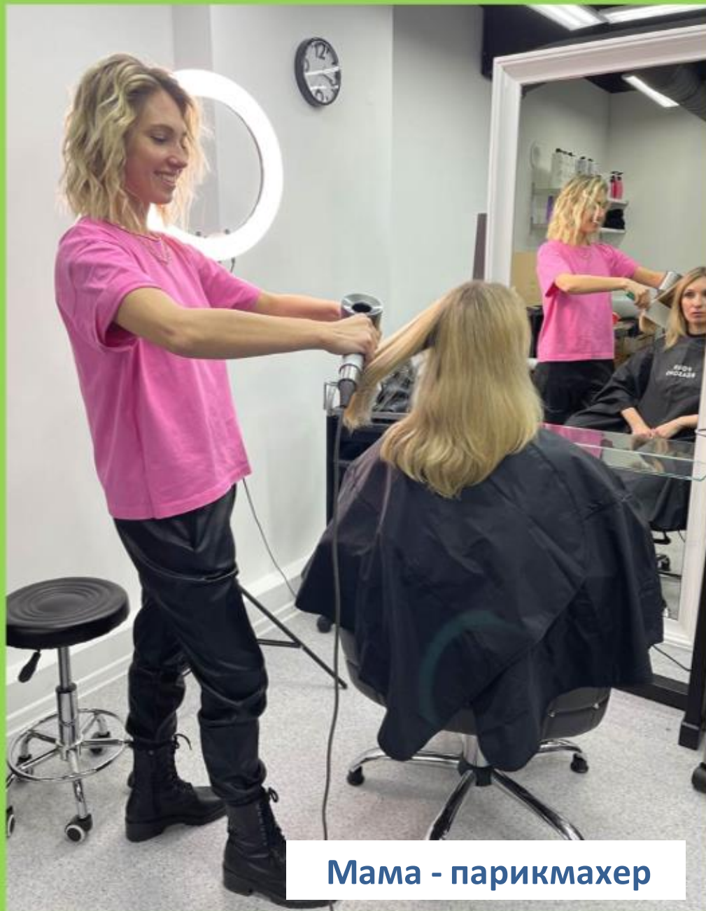
Мама - парикмахер