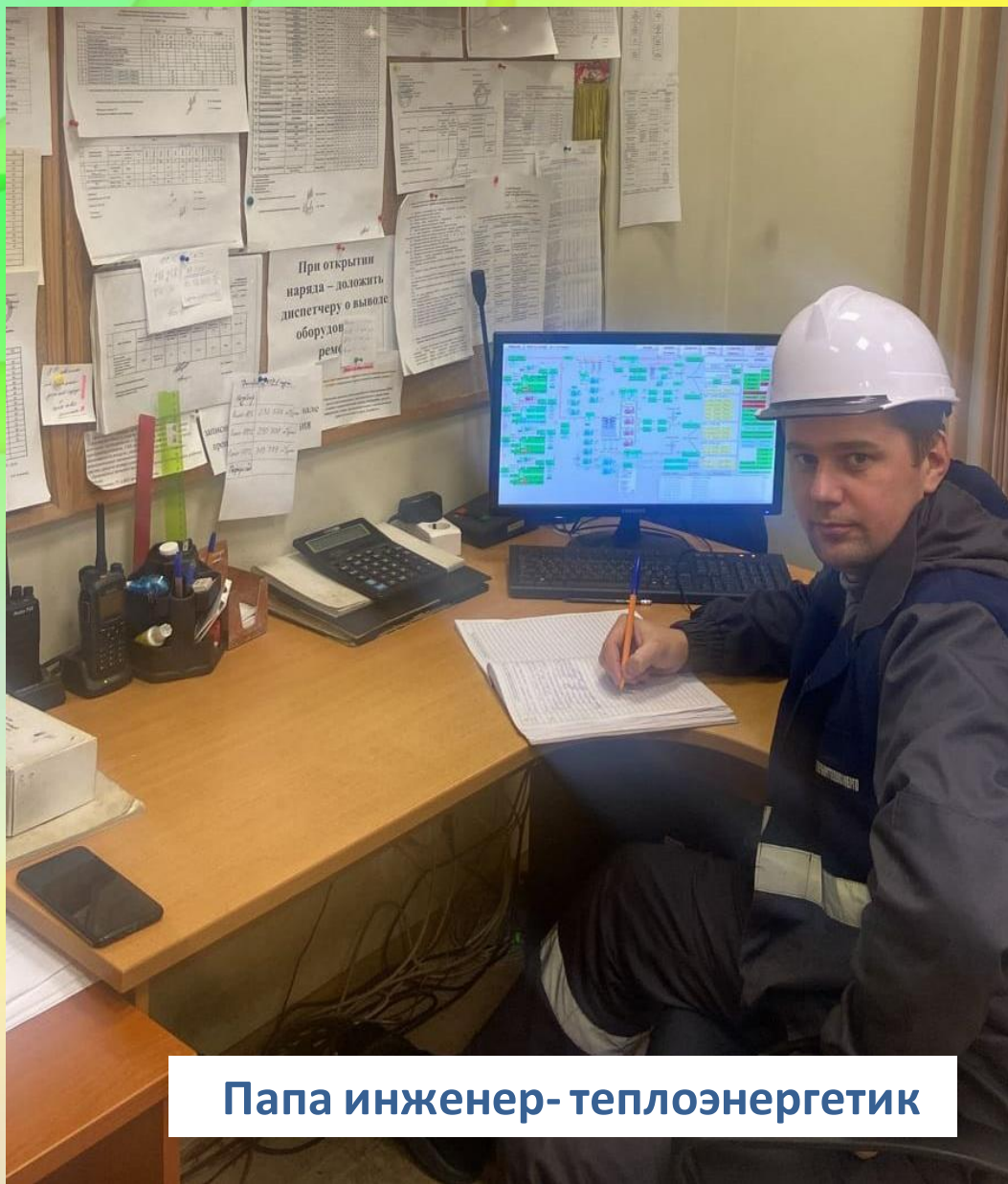
Папа инженер- теплоэнергетик