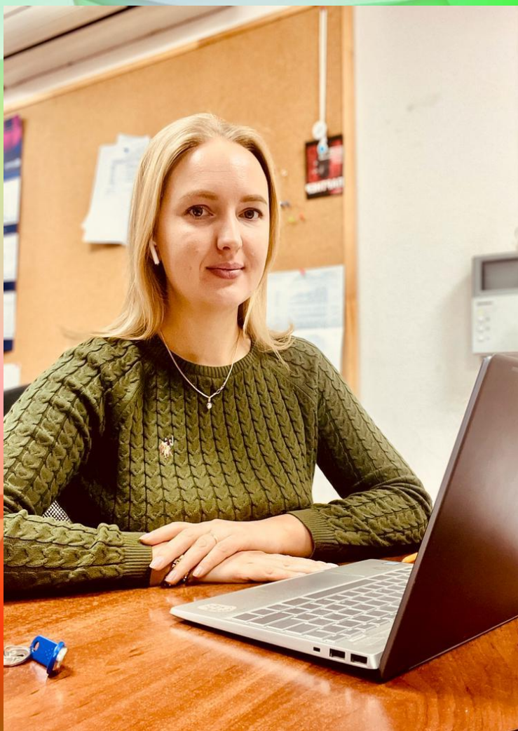
Мама директор по развитию